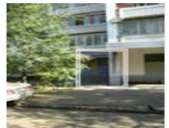
Рис. 4. Месторасположение парикмахерской

Собственнику желательно создать поток посетителей хотя бы 150 человек в неделю. Ассигнования, выделенные собственником на продвижение парикмахерской – не более 100 000 рублей. На той же улице четыре месяца назад открылась парикмахерская-конкурент на 4 посадочных места. Никаких услуг, кроме стрижки, не оказывают. Помещение крохотное, люди ждут своей очереди прямо в салоне. Работают 18-летние гастарбайтеры из Молдовы и Украины.